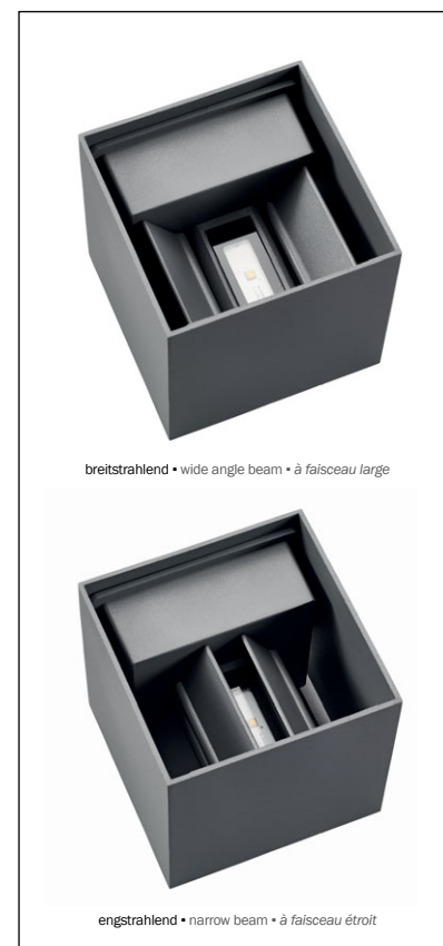
breitstrahlend • wide angle beam • à faisceau large