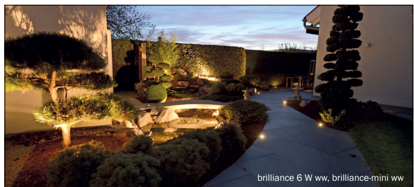
brilliance 6 W ww, brilliance-mini ww