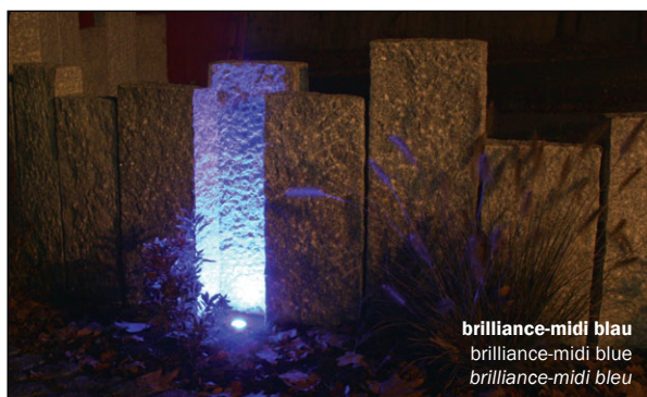
brilliance-midi blau brilliance-midi blue brilliance-midi bleu

Weiteres Zubehör ab Seite • additional accessories from page • autre accessoires à partir de la page ▶ 46 + 116